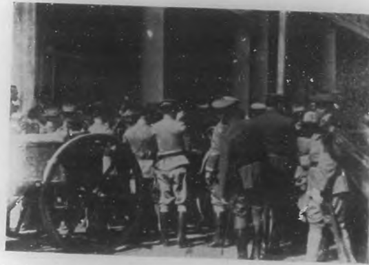
Los funerales del General Monteagudo en Santa Clara.—Momentos de ser colocado en el armón de Artillería el sarcófago.

Y a esa representación dedicó sus esfuerzos, sus fervores, sus an-