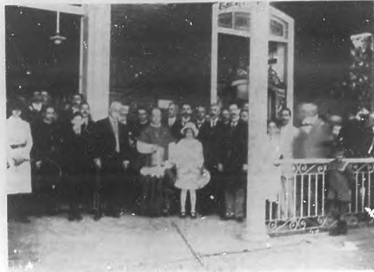
EN LA QUINTA DEL CENTRO DE DEPENDIENTES.—El Sr. Gobernador, Sr. Obispo y otras personalidades, visitando la grandiosa Quinta de Salud "Purísima Concepción", con motivo de dicha festividad.

Recibimos tarde las fotografías, pero una vez en poder nuestro las publicamos como un recuerdo y una oírenda al gran patriota que tan denodadamente laboró por la gloria y felicidad de la Patria.