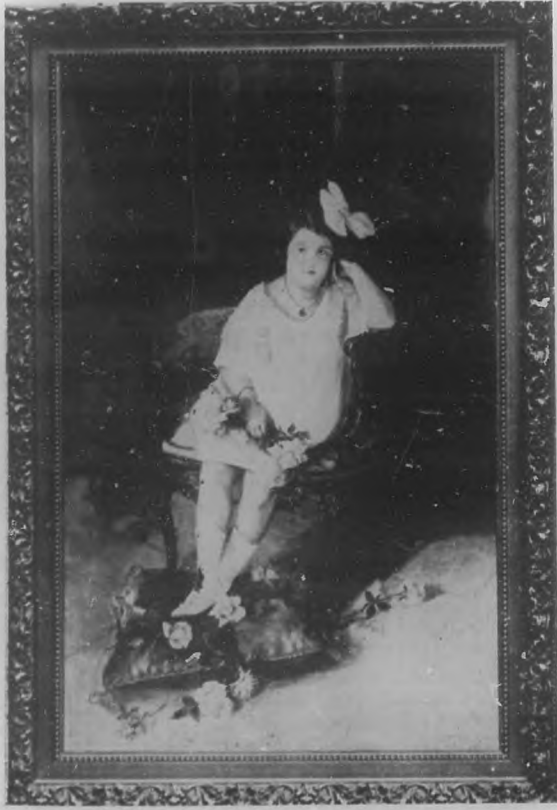
Retrato de la niña Lucrecia Romaná, óleo notable de la pintora Sra. Ceferina de Luque.

Dedicada, como decimos, esta edición a la Casa del Pueblo, en ella constará el historial detallado del Municipio habanero, y de sus hombres notables hablaremos, de sus triunfos, de