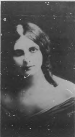
La Opera en New York.—Señorita Raymonde Delaunois, famosa tiple belga que ha debutado en la ópera rusa "Boris Goudonoff".

En el número próximo de "Bohemia - Música" aparecerá un trabajo del eminente maes-