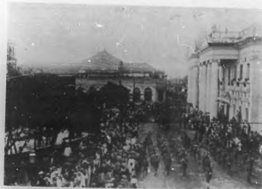
Los funerales del General Monteagudo en Santa Clara.—Momentos de pasar el cortejo fúnebre por el Gobierno Provincial de Santa Clara.

Todavía se recuerda la fiesta brillante con que la juventud honró al General a la vuelta de la guerra. Al saludar a aquel ejército de campeones y abnegados se le aclamó con una ovación delirante, y al caudillo, al soldado inclito, al ciclope del deber y de los ideales le rindió