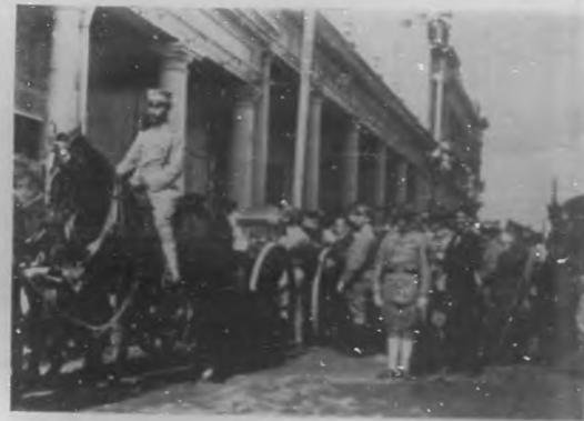
Los funerales del General Monteagudo en Santa Clara.—Momentos de emprender la marcha el fúnebre cortejo.

Cubano eminentemente por su patriotismo, cultura y ciencia; como mil-