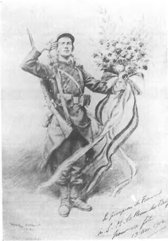
El último soldado de Francia a la mejor Reina, la santa madre de los belgas.

de caballero y rey, y cuando ha convenido al que daba su honor en su palabra, el vocablo se ha convertido en chiste cruel de polichinela, en una expresión de circunstancias alevosas, y se ha pulverizado en la orgía de la muerte el significado de ese valor de la conciencia.