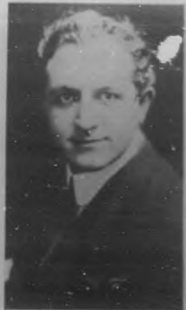
La Opera en New York.—Pascual Amato, famoso barítono que actúa en el Metropolitan.

Reciba nuestra felicitación al querido compañero, y al tomar