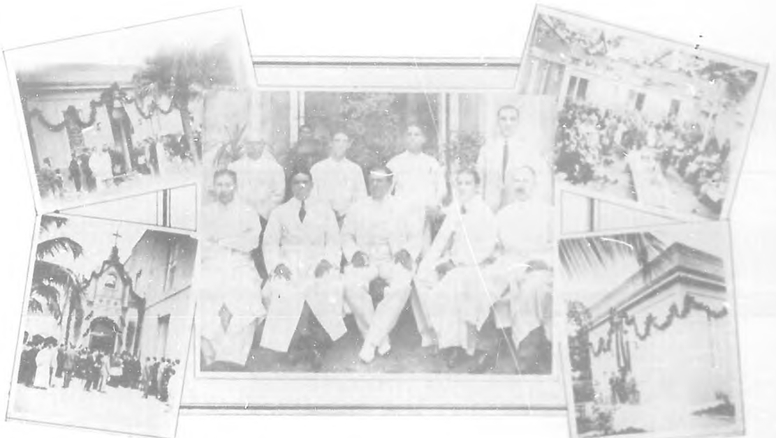
LA COLONIA ESPAÑOLA DE MATANZAS.—Vistas del acto realizado el domingo pasado por la Colonia Española en la inauguración de su Casa de Salud...