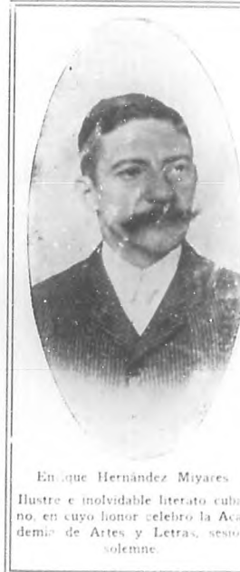
En que Hernández Miyares. Ilustre e inolvidable literato cubano, en cuyo honor celebra la Academia de Artes y Letras, sesión solemne.