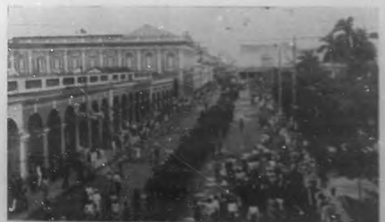
EN CIENFUEGOS.—Entierro del general Higinio Esquerro, otro aspecto del fúnebre cortejo al pasar por la calle de San Fernando.

Nosotros que ya nos hemos ocupado en otra ocasión de la muy talentosa artista y que conocemos sus excepcionales dotes por el difícil arte de la pintura, nos complacemos hoy en admirar su magistral trabajo lleno de vida, de corrección y