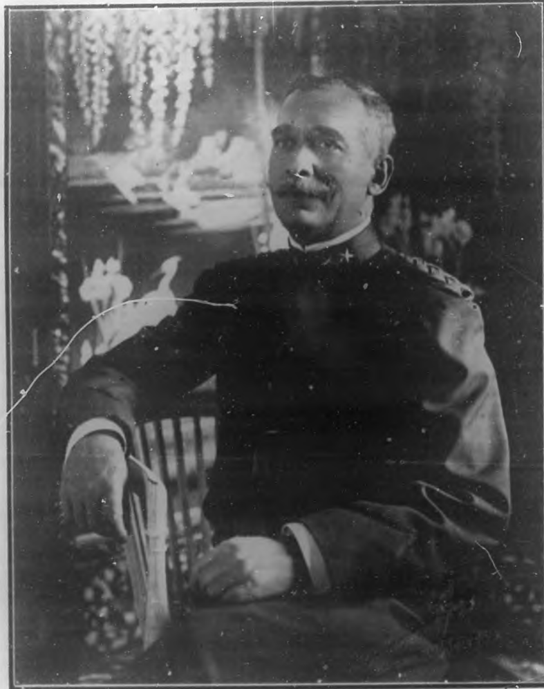
† MAYOR GENERAL JOSÉ DE JESÚS MONTEAGUDO Jefe de las Fuerzas Armadas de la República.

Nunca se ha podido decir con más propiedad de un cubano ilustre, que su nombre brilla en la Historia de Cuba y que su esplendor irradia del sentimiento patriótico que lo consagra entre los inmortales nacidos en este suelo; de pocos puede decirse con igual verdad