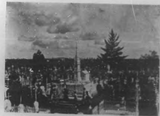
Los funerales del General Monteagudo en Santa Clara.—Vista general del Cementerio de Santa Clara. En último término puede verse a la concurrencia que asistiera al acto del enterramiento del general Monteagudo.

Ha recibido cristiana sepultura su cadáver en Villa Clara, cuyo pueblo con extremo recogimiento, poseído de dolor intenso, ha dado ejemplo vivo de entrañable cariño a su ilustre y predilecto hijo.