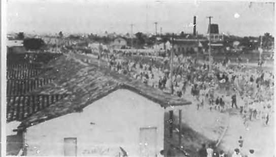
EN CIENFUEGOS.—Entierro del general Higinio Esquerro, aspecto del fúnebre cortejo, al pasar por el Paseo de la Reina.

"Flora Mora, de exquisito temperamento, con dominio de sus facultades mecánicas y de ligada dicción, interpretó con extraordinaria dulzura esas escenas infantiles, a las que supo imprimir una misteriosa vaguedad, y la impresión nostálgica